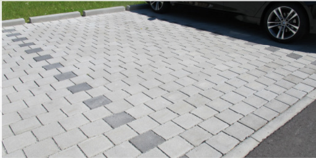
Vario Drain Fugenbild: 1 cm Farbe: naturgrau