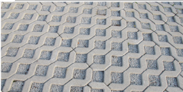
Rasengitterstein 60x40 cm Farbe: naturgrau