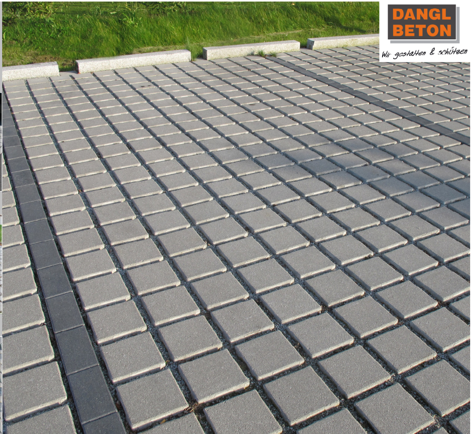
Dangelit-Öko Fugenbild: 2,5 cm Farbe: naturgrau