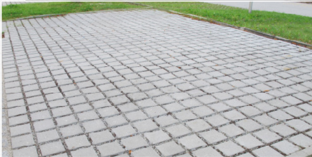
Rasenfugenstein Fugenbild 3 cm Farbe: naturgrau